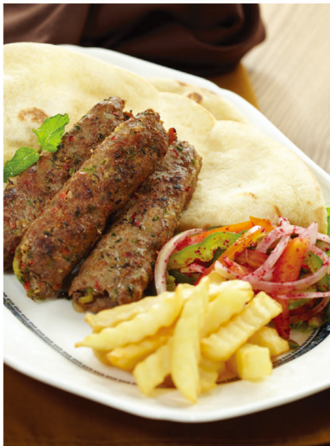
كفتة كباب Kuftah Kebab Rp. 115,000,-

House speciality marinated of grilled ground meat served with bread and salad Daging cincang kambing muda di grill, di sajikan dengan roti pita dan sayuran