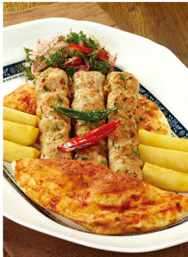
كفتة دجاج Kuftah Dujaj Rp. 75,000,-

House speciality marinated of grilled ground meat served with bread and salad Daging cincang kambing muda di grill, di sajikan dengan roti pita dan sayuran