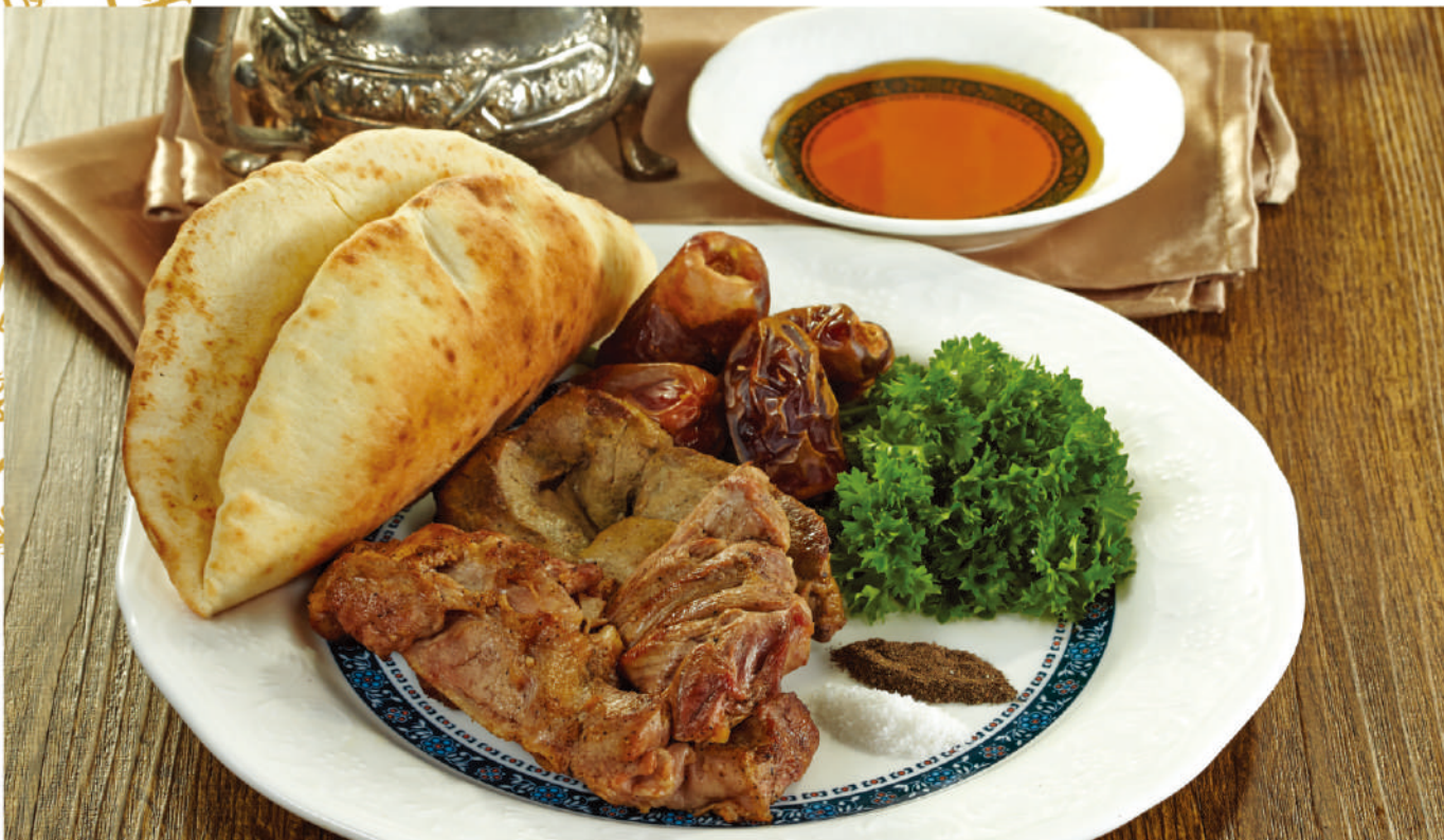
لحم مطبّي خاص لارازيتا Roasted lamb serve with arabic honey, tahina, and dates and pita bread Mathbi Lahm Ala Larazeta Kambing muda pilihan, di bakar di atas batu, disajikan dengan madu, merica, garam dan roti pita Rp. 110,000,-